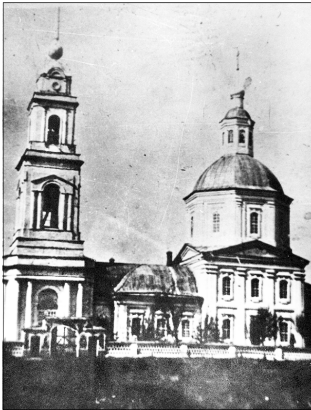
Рождественская церковь в с. Чертедь (начало XX века)