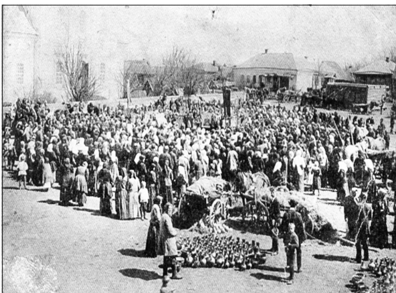
Ярмарка в с. Чертедь (конец XIX- начало XX века)

Особый вклад в дело процветания уезда внесло купечество. Это та категория людей, которая имела немалые материальные и денежные средства, а значит обладала большим влиянием в обществе, властью. И, конечно, не в пример многим нынешним нашим миллионерам и миллиардерам, львиную часть своих доходов купечество направляло на строительство храмов, школ, жилья, хозяйственных объектов. А запросы на удовлетворение потребностей у купцов, которых можно отнести по нынешним меркам к представителям малого и среднего бизнеса, довольно контрастно отличаются от многих нынешних наших крутых денежных воротил.