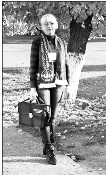
К вам идет переписчик

— Безусловно. Определены место и время стационарных счетных участков. Время их работы с 8.00 до 21.00 часов. Расположены они в г. Мосальске по ул. Советской, д.16 (здание районной администрации), телефоны: 2-10-68, 2-13-43, в д. Савино по ул. Центральной, д.2 (здание администрации сельского поселения), телефон 2-19-79, в д. Людково по ул. Шоссейной, д. 11 (здание администрации сельского поселения), телефон: 2-51-81. Любой желающий с 14 по 25 октября может пройти перепись на этих стационарных счетных участках.